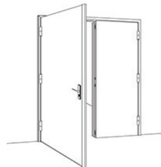
Bloc-porte 2 vantaux

Cette gamme constitue la solution optimum, pour répondre aux problématiques de rénovation de sites industriels ou d'importance vitale, grâce à ses multiples configurations, sa facilité d'installation et d'utilisation.