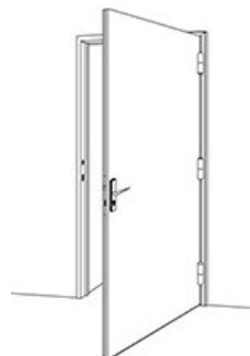
Bloc-porte 1 vantail